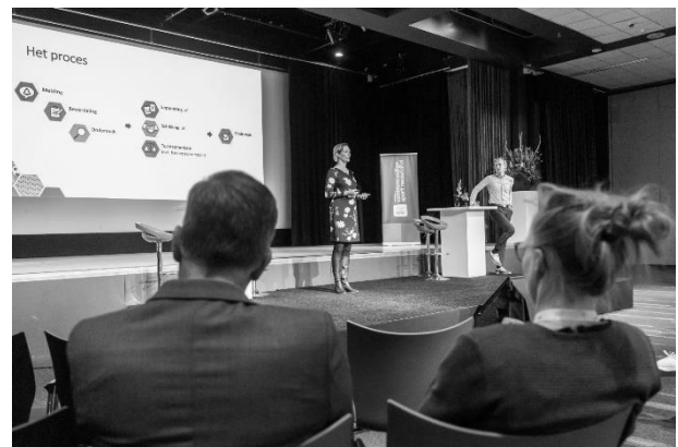
Het ISR geeft een workshop tijdens het congres Centrum Veilige Sport Nederland in mei 2022.

In mei 2022 heeft het ISR deelgenomen aan het congres 'Blijf je stil of praat je erover' van het Centrum Veilige Sport Nederland in Hotel en Congrescentrum Papendal. Het ISR was aanwezig op deze drukbezochte bijeenkomst om vragen te beantwoorden en heeft een workshop over tuchtrecht in de sport verzorgd.