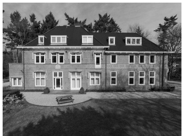
Het ISR is gevestigd in 'Landhuis 't Holtink' aan de Utrechtseweg in Hilversum..

Het ISR is per januari 2022 gevestigd aan de Utrechtseweg in Hilversum waar het de benedenverdieping van een (gedeeld) kantoorpand betreft.